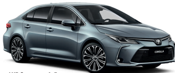
1K3 Серо-голубой металл