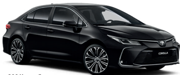
209 Черный металлик