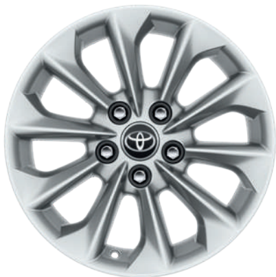
Легкосплавные диски, шины 205/55R16