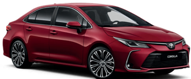
3T3 Темно-красный 5