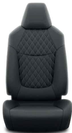
Черная ткань с ромбовидной прострочкой