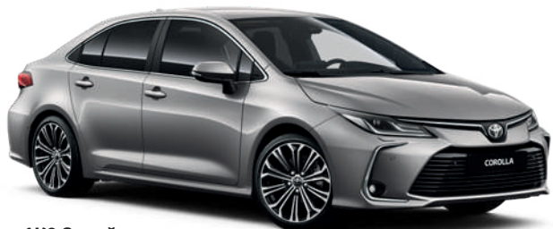
1K0 Серый металл