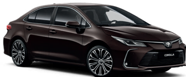
4W9 Темно-коричневый металл