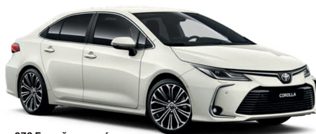
070 Белый жемчуг 5