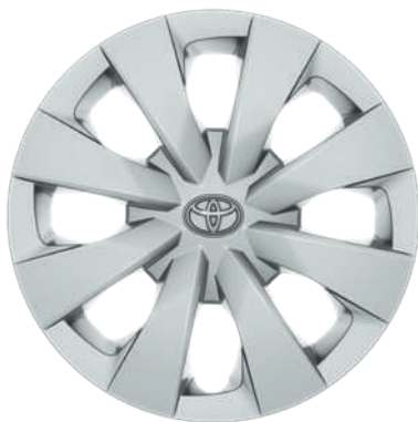
Стальные диски, шины 195/65R15