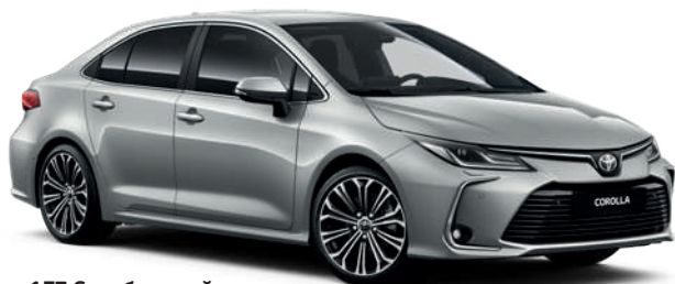
1F7 Серебристый металлик