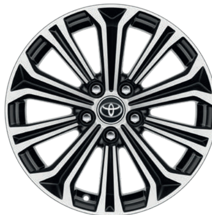
Легкосплавные диски, шины 225/45R17