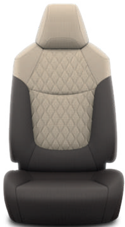
Бежевая ткань с ромбовидной прострочкой