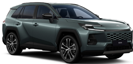
Жашыл металллик (6X7)