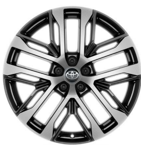
Жеңил эрме дисктер 20" "Люкс" комплектациясы