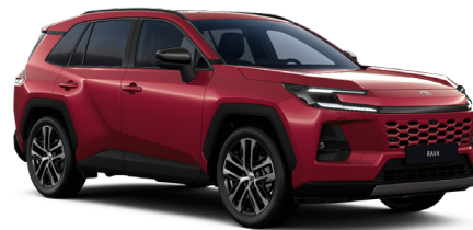
Кызыл металллик (3Т3)