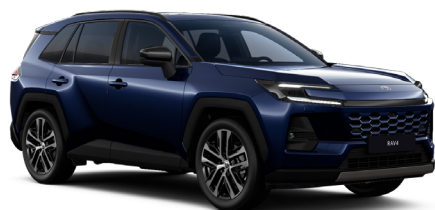
Кара-көк металллик (8X8)